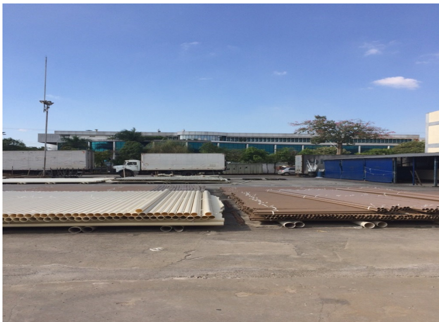
Estoque - Pátio Externo