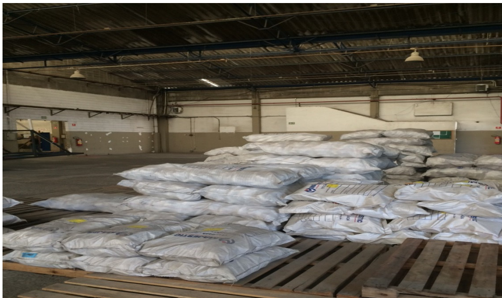
Estoque – Interior da Fábrica