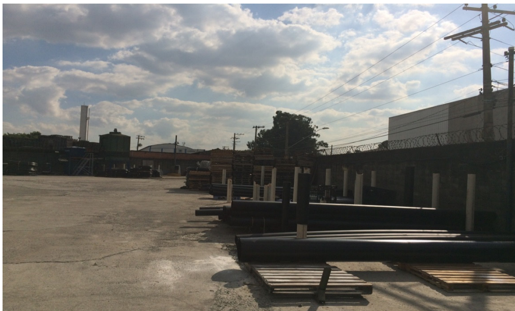
Estoque – Interior da Fábrica