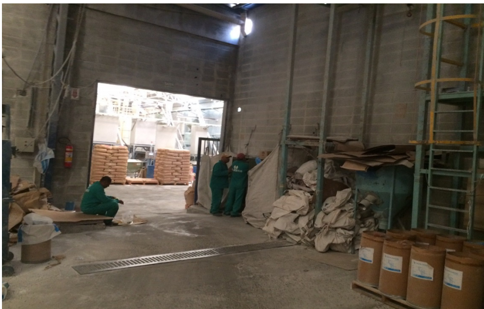
PÁTIO INTERNO – MAQUINÁRIO