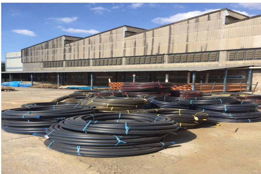
Estoque - Pátio Externo