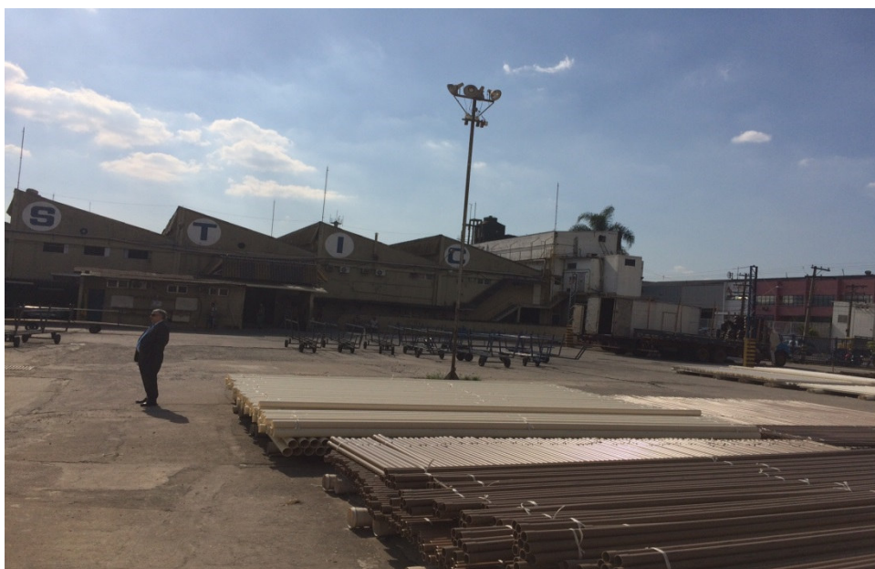
Estoque – Pátio Externo