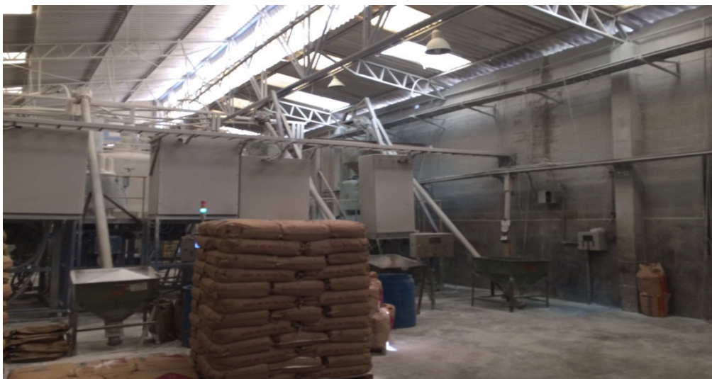
PÁTIO INTERNO – MAQUINÁRIO