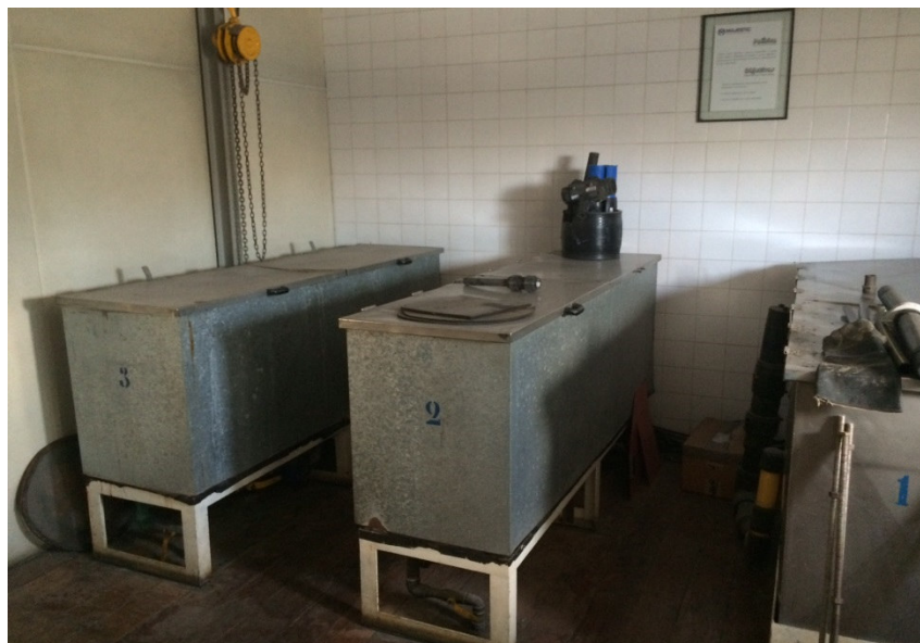
Estoque – Pátio Externo