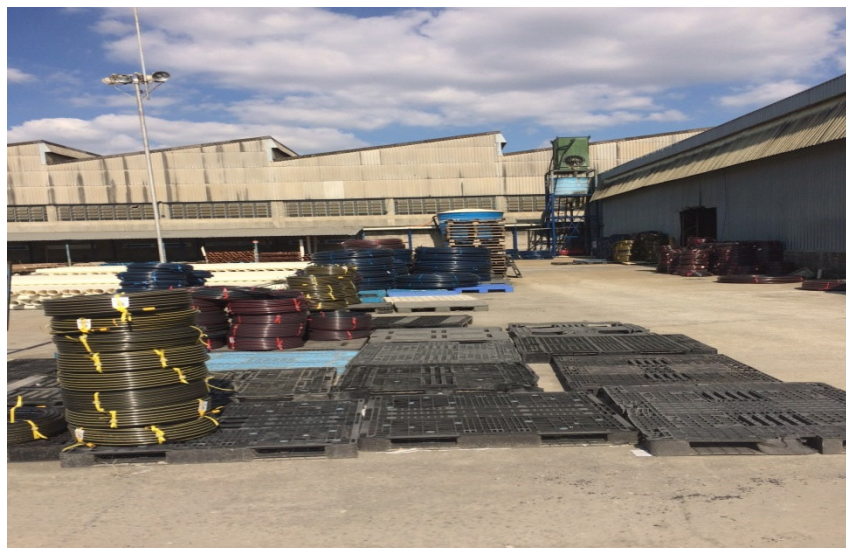
Estoque – Pátio Externo