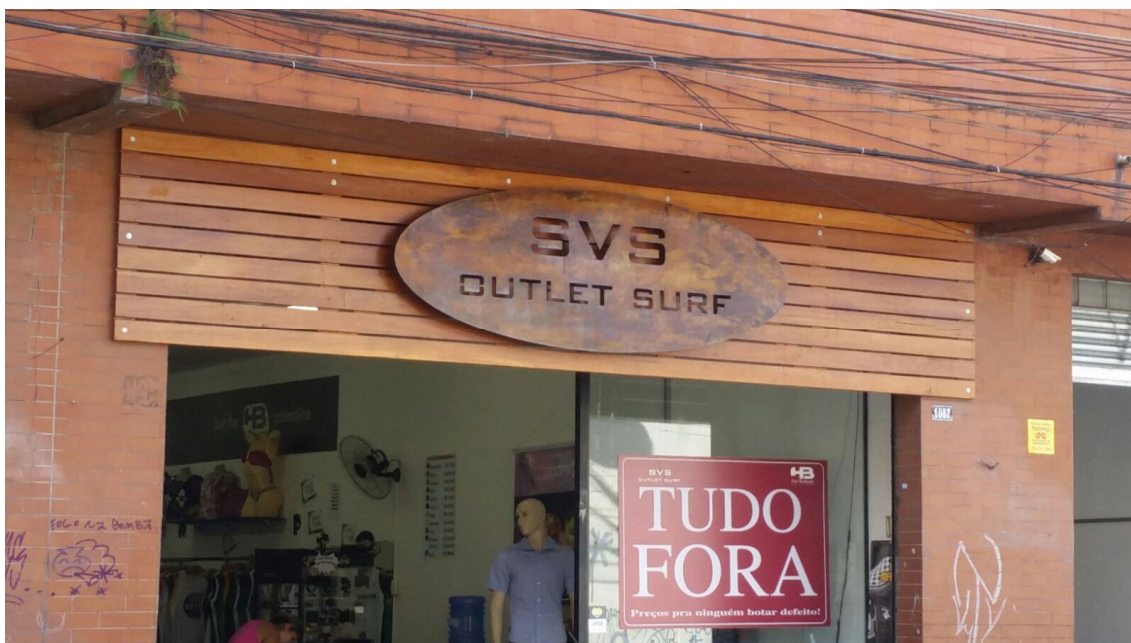
Frente da Loja – 01/02/2016