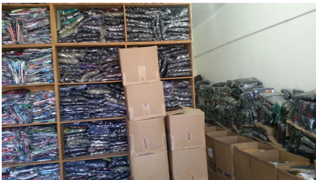
Expedição – 01/02/2016