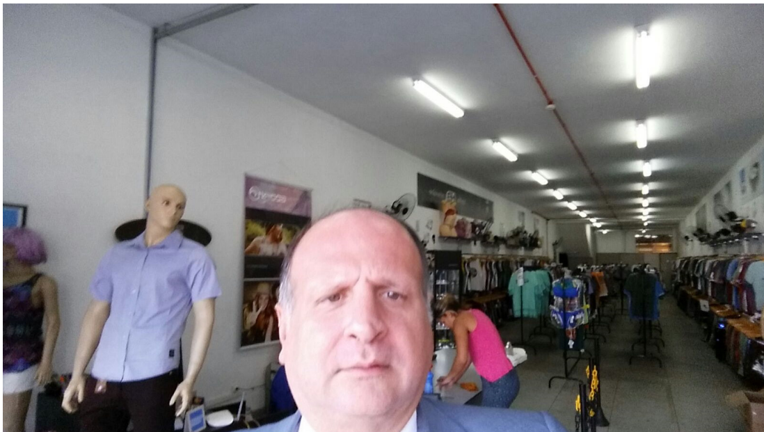
Loja – 01/02/2016