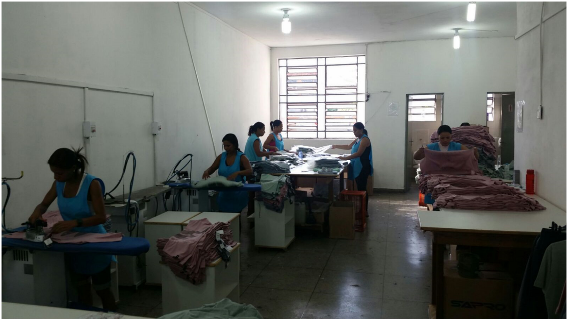
Setor de acabamento – 01/02/2016