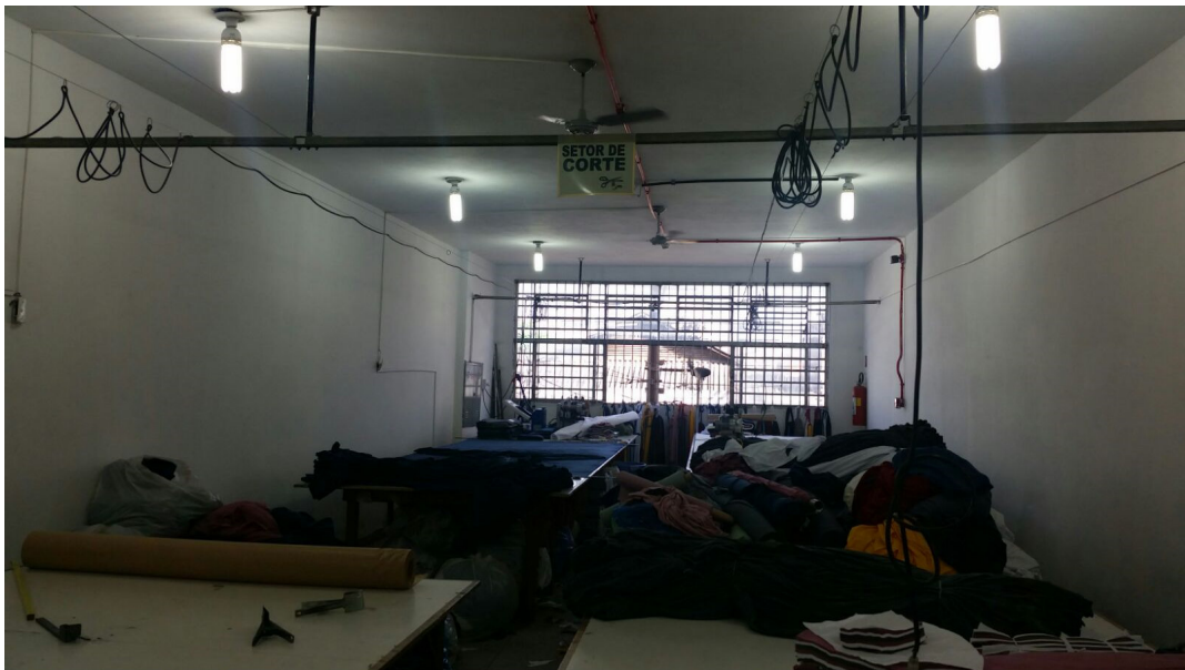
Setor de corte – 01/02/2016