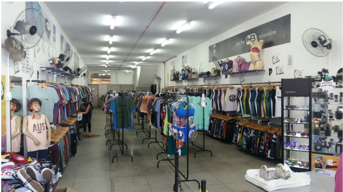
Loja – 01/02/2016