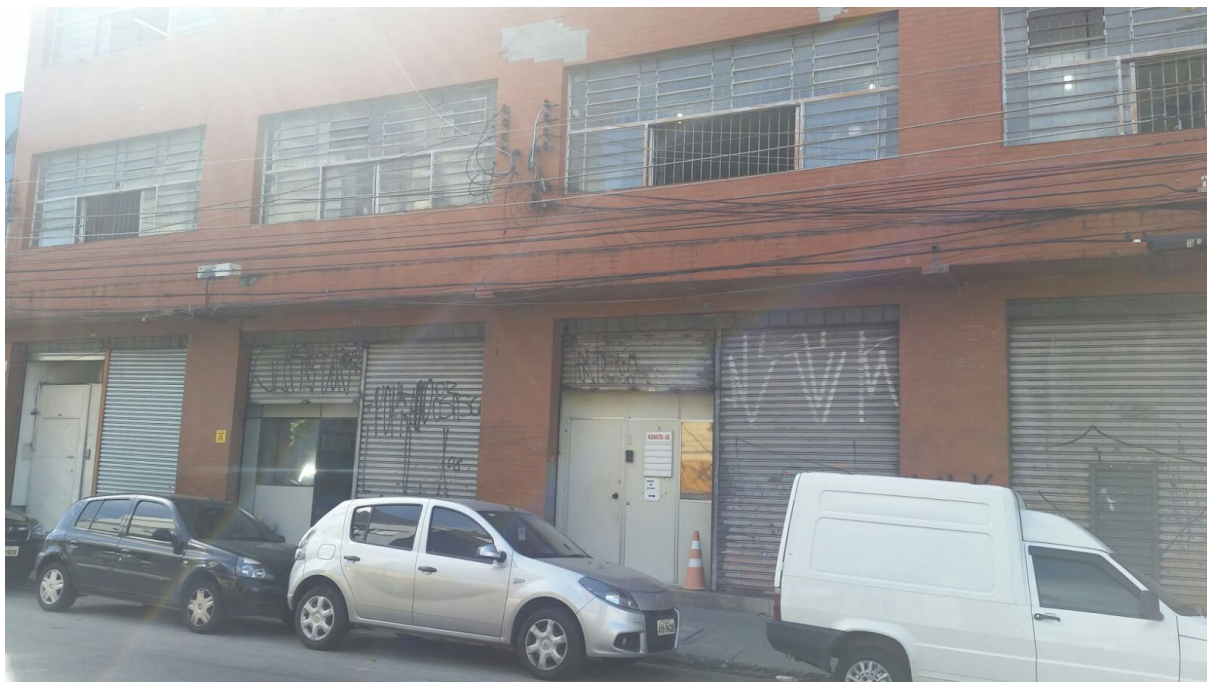
Frente da Fábrica – 01/02/2016