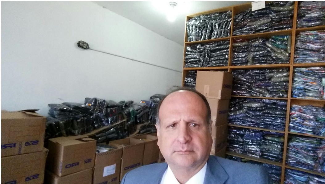
Expedição – 01/02/2016