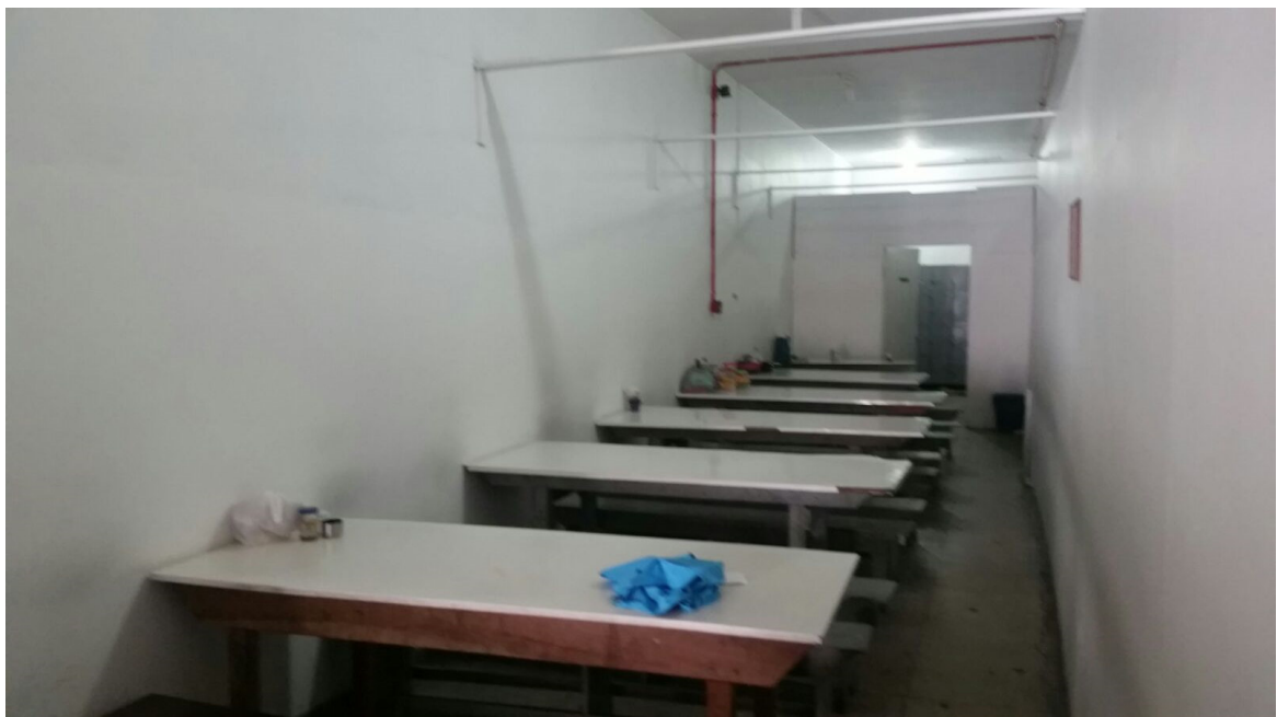
Refeitório – 01/02/2016