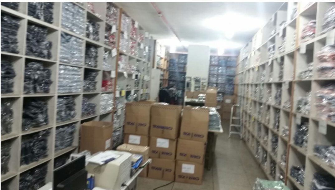
Estoque – 01/02/2016