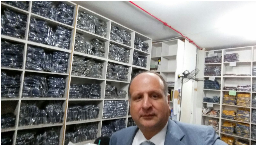
Estoque – 01/02/2016