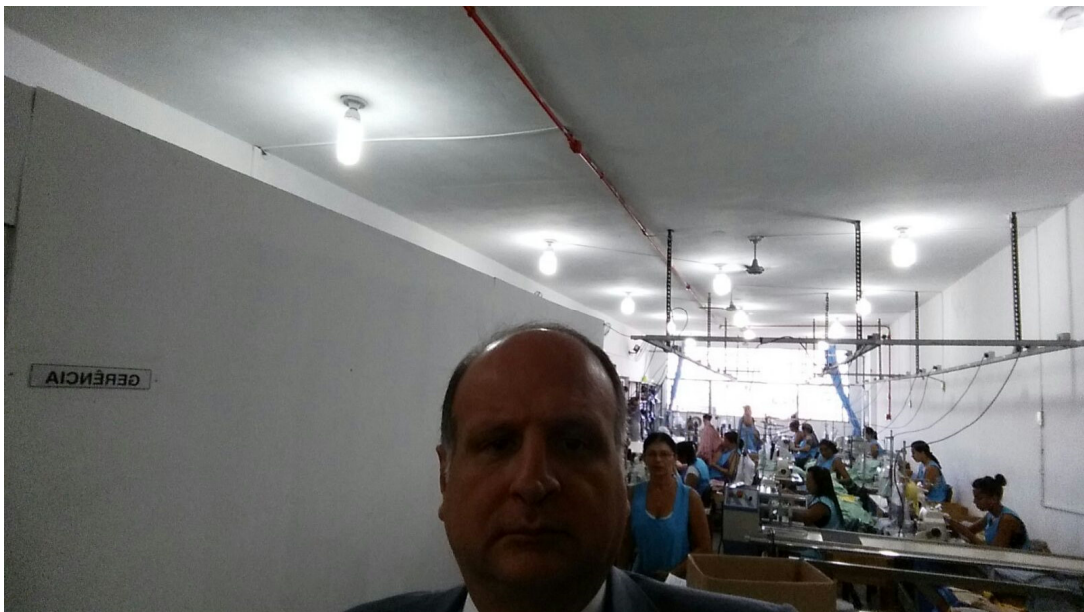
Setor de costura – 01/02/2016