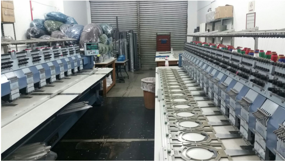
Máquinas de bordar – 01/02/2016