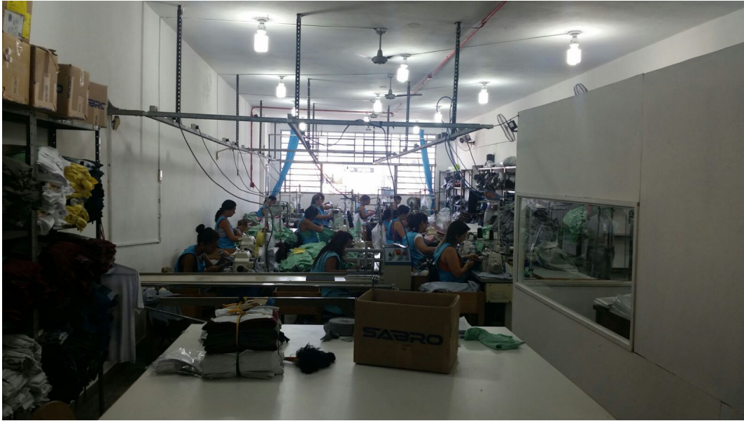
Setor de costura – 01/02/2016