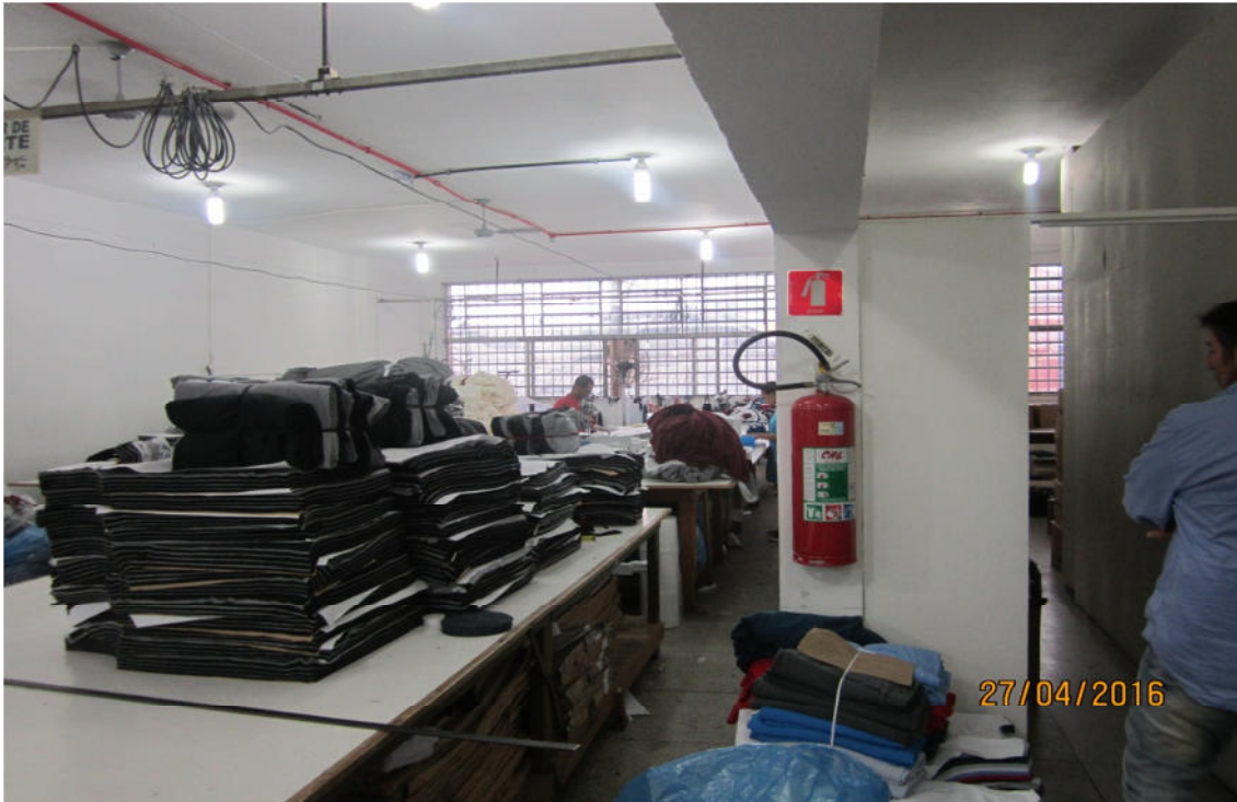
SETOR DE CORTE