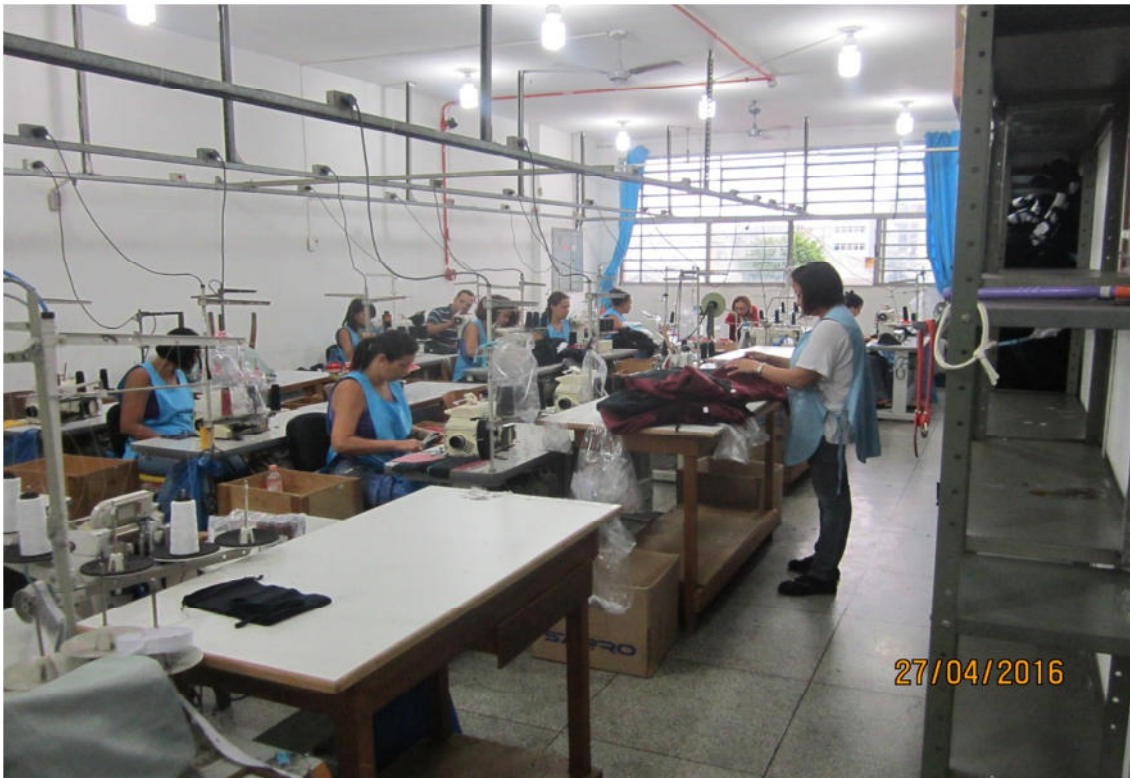
SETOR DE COSTURA